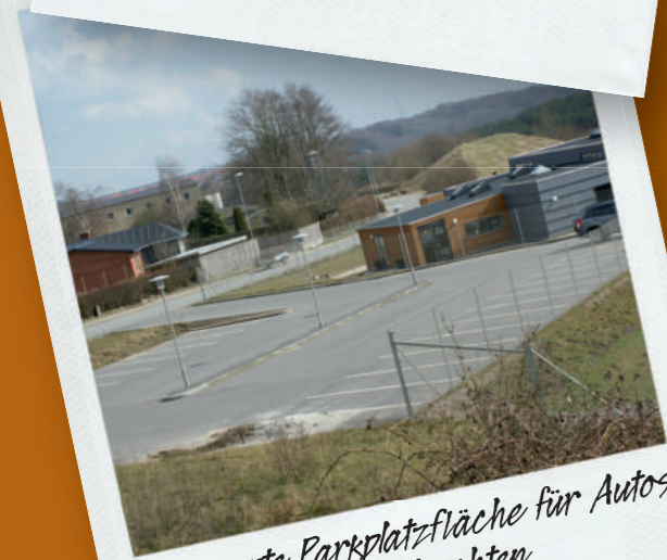
Markierte Parkplatzfläche für Autos inklusive Parkplatzleuchten