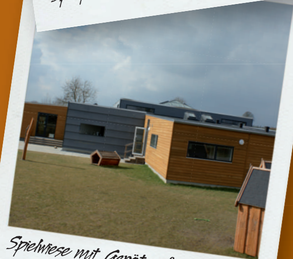
Spielwiese mit Geräten für Hortkinder