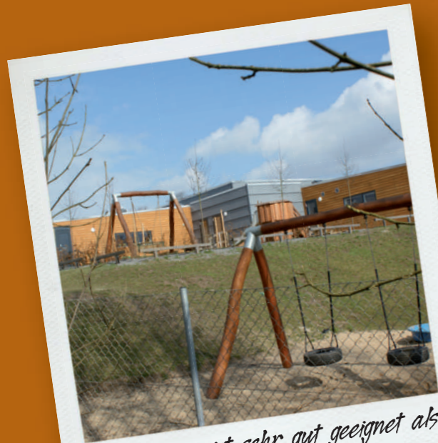
Grundstück ist sehr gut geeignet als Spielplatz