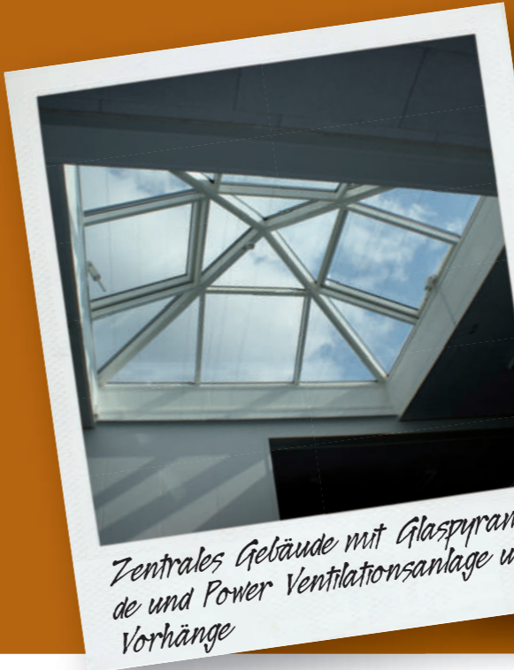
Zentrales Gebäude mit Glaspyramide und Power Ventilationsanlage und Vorhänge

09006 - Reservierung für Druckfehler und Preiserhöhungen und ohne MwSt.