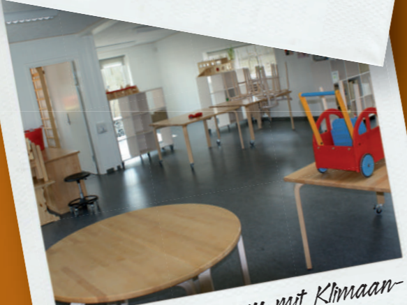
75m 2 Gruppenraum mit Klimaanlage