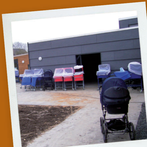
40m 2 Krabbelraum