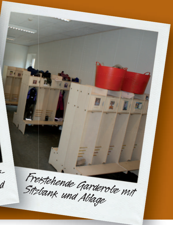
Freistehende Garderobe mit Sitzbank und Ablage

ABC Pavilloner A/S Fundervej 44 DK-7442 Engesvang T +45 8681 2630 www.abcpavilloner.dk